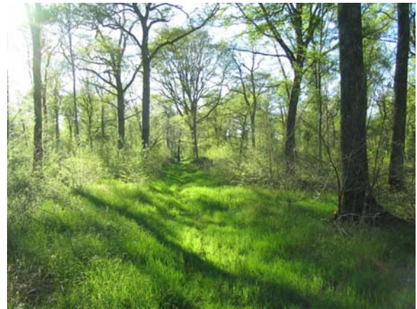
Chênaie claire: ornières à Sonneur à ventre jaune