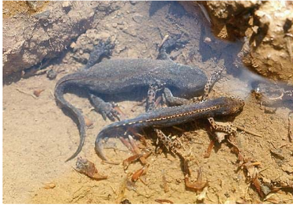
Couple de Triton alpestre